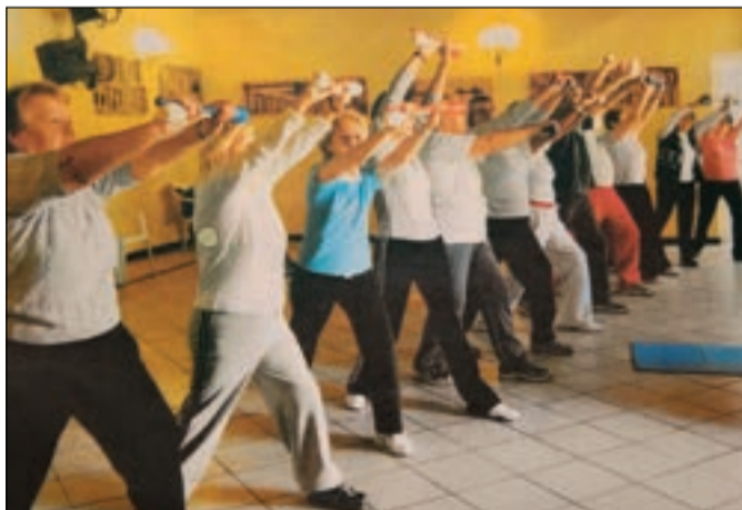
In movimento Attività motoria e posturale