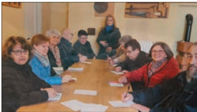
Lucidamente Stimolazione cognitiva

...E ATTRAVERSO LA SOCIALIZZAZIONE CON IL "PROGETTO BENESSERE" E "GINNASTICA DOLCE".