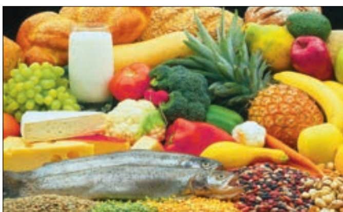
Alimentare Mangiare sano e con gusto