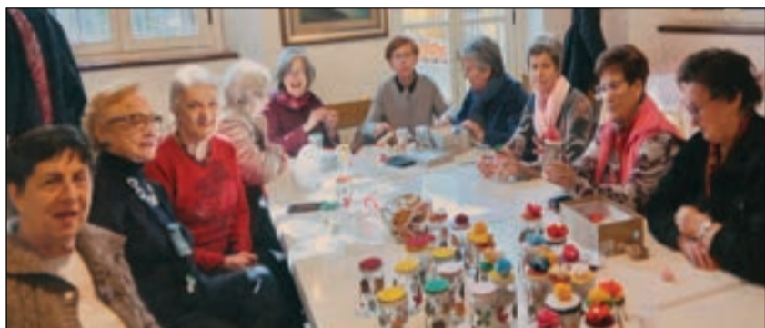
Angolo rosa Laboratorio creativo