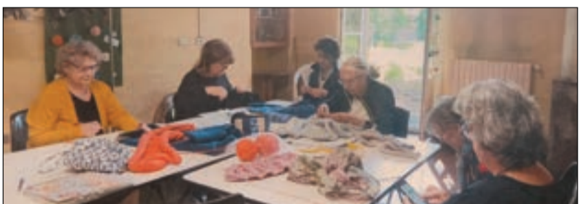
Punto e a capo Laboratorio creativo con la lana