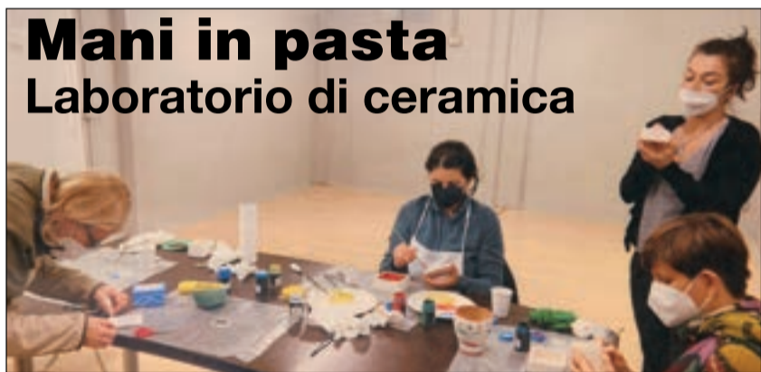
Mani in pasta Laboratorio di ceramica